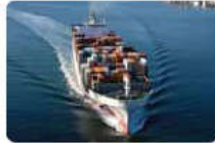
Vận tải quốc tế International freight forwarder