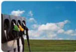
Kinh doanh xăng dầu Petroleum Trading