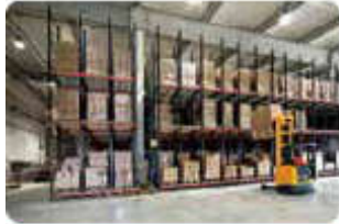
Dịch vụ kho Warehousing