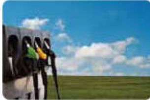
Kinh doanh xăng dầu Petroleum Trading