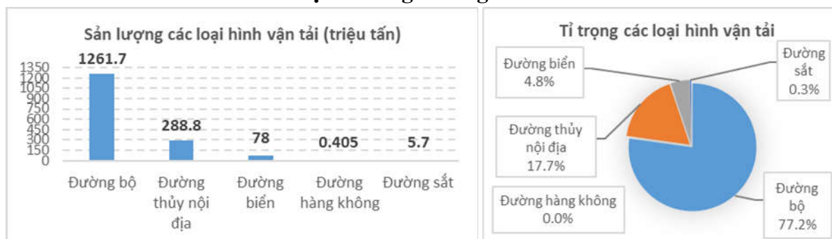
Biểu đồ 2: Chỉ số các loại hình ngành logistics.