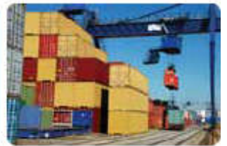
Cảng thông quan nội địa Inland clearance depot (ICD)